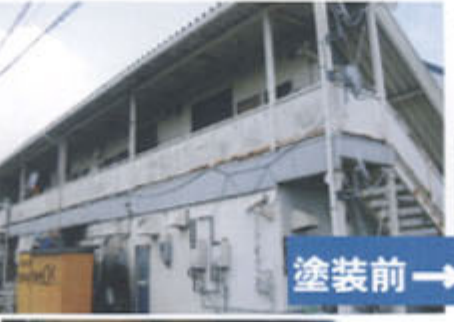
塗装前 → 塗装後