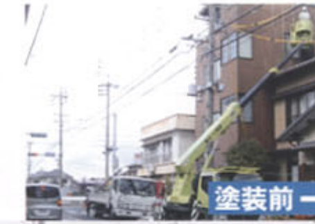
塗装前 → 塗装後