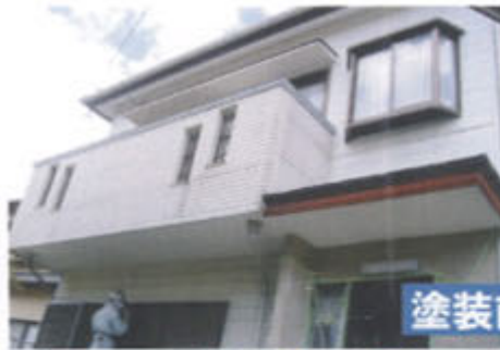
塗装前 → 塗装後