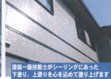
塗装一級技能士がシーリングにあった 下塗り、上塗りを心を込めて塗り上げます