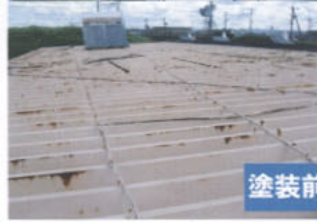
塗装前 → グレー色下塗りサビ止め後 くぎ頭にキャップ張り工事後