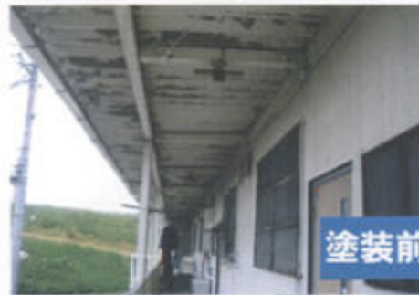
塗装前 → グレー色下塗り後(サビ止め) クリーム色をカラー塗りハケ仕上げを2回塗り