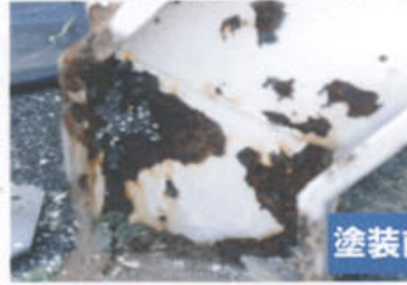
塗装前 → 下地調整樹脂 モルタル工事一式