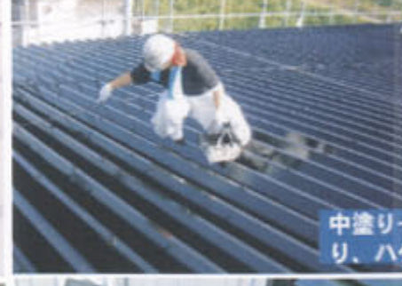
中塗り → 上塗りをローラー塗り、 ハケ仕上げ一式