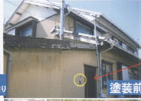
塗装前 → 塗装後