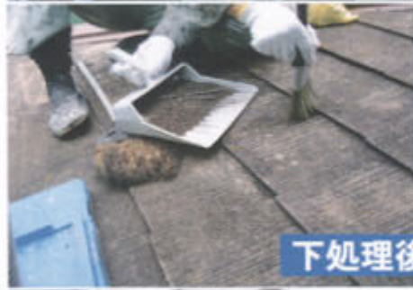
下処理後 → 高圧洗浄水洗い