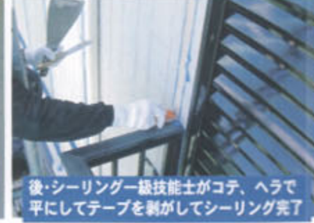
後・シーリング一級技能士がコテ、ヘラで 平にしてテープを剥がしてシーリング完了