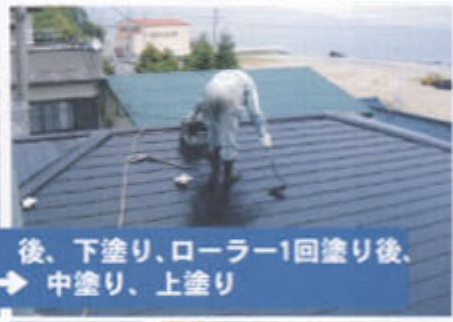
後、下塗り、ローラー1回塗り後、 → 中塗り、上塗り