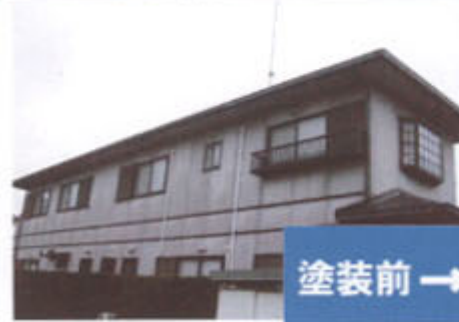
塗装前 → 足場高圧洗浄後全てにテープ施工をして ふるいシーリング防水コーキング撤去後全面 シーリングブレンダー後バックアップ材を入れて シーリング打ち工事